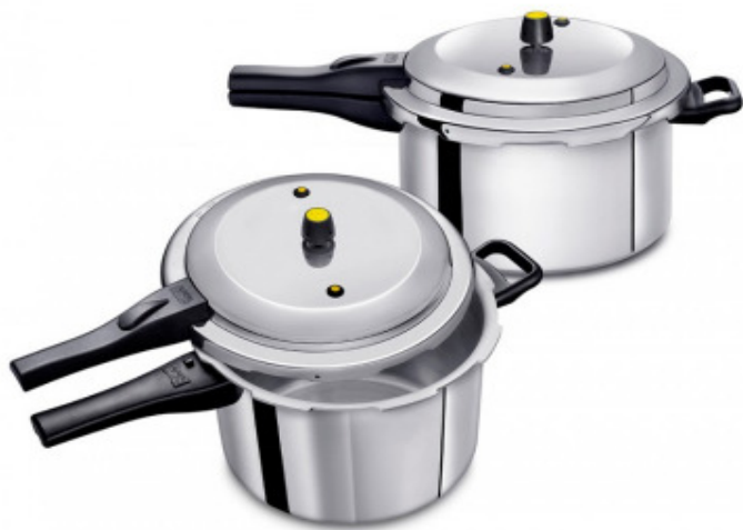
Panela de Pressão Fechamento Externo Cabo Baquelite Hotel 12 L